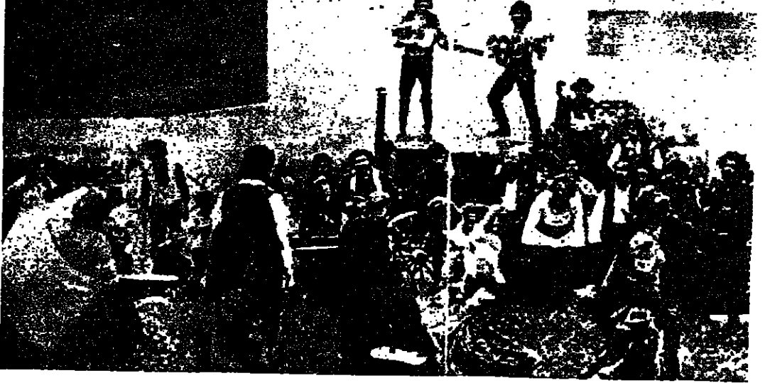
لقطة من الفيلم

القيام السوفياتي « الفجر يصعدون إلى السماء » أخرجه اميل لوتيانو وقام ببطولته كل من جريجوريه جريجوريه في دور « رادا » وصوره بالالوان سيرجيه لرونسكي ولكن موسيقيا يوجين دوجا . الفيلم من افضل الافلام السوفياتية ويحتوي قصة الفجر والشجاع « زويار » الذي يترجم مجموعة لصوص جيبان من بسطون على جيبانموسى وجالوت الحرس الابراهامي حيث يلاحقهم الحرس فيقتلون احدهم بينما يصاب زويار بجراح شديده منها ويقتوس سحرية تجرعه فاشقة مجان . فالحرية هي اثن ما في الوجود .. ورغم ان رادا احدث زويار الا انها احبت حريتها اكثر وكلت هو وهنا كان لابد ان ينتهي لقاءها الى ماسة فمعية على صعيد واقفي ولكن على صعيد رمزي كان هذا الفراق المأساوي هو قمة اللقاء العنوي والرمزي لهما بكل مفاهيمها الانسانية التي احياها معا وعاشا معا طوال حياتهما المليئة والاشواق بالخير من التاهية السينمائية تبدو براعة لوتيانو السينمائية في تلك الانتصارات الكلية التي يفسها في مشهدة فليمة اثنتي عشرة مليون